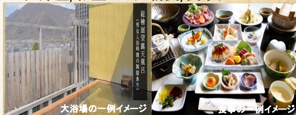
大浴場の一例イメージ

チェックイン/15:00 チェックアウト10:00 ○お部屋/和室 ○夕朝食/食事処