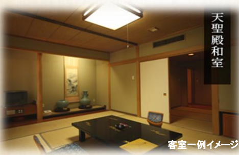
客室一例イメージ

敷地内に湧く自噴温泉が自慢の宿。 湯量は1日300万リットルを誇り、当館自慢の「美人の湯」100%源泉かけ流しの、究極の美肌湯をご堪能ください。