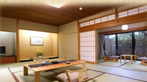
客室一例イメージ

太陽が燦々と降りそそぐブルーサイド、開放的な空間が演出する至福のリゾート「ホテルふじ」で旅の思い出をより深くする、特別な時間をお楽しみください。