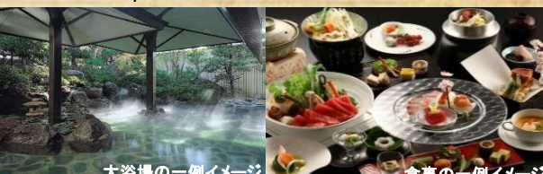
大浴場の一例イメージ

チェックイン/15:00 チェックアウト12:00 ○お部屋/和室・洋室(温泉付き有り) ○夕朝食/食事処