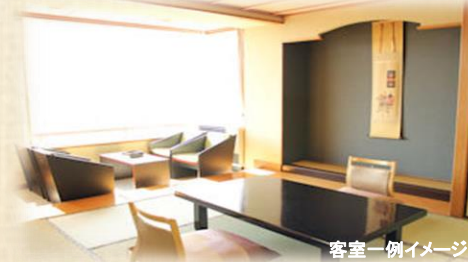
客室一例イメージ

チェックイン/15:00 チェックアウト10:00 ○お部屋/和室 ○夕朝食/個室食事処