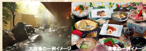
大浴場の一例イメージ

チェックイン/15:00 チェックアウト10:00 ○お部屋/和室・洋室(露天風呂付有り) ○朝食/バイキング 夕食/個室又は部屋