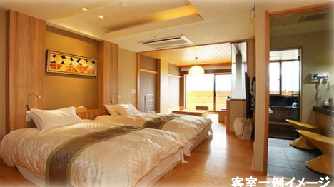
客室一例イメージ

湯量豊富な自家源泉かけ流しの温泉と会席料理をはじめとする地元の新鮮な食材を活かした多彩なお料理が自慢の宿。毎晩開催の慶山太鼓ショーがご堪能いただけます。