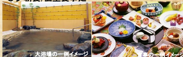
大浴場の一例イメージ

チェックイン/14:00 チェックアウト11:00 ※お部屋の種類で時間が異なる場合がございます。 ○お部屋/和室・和洋室(露天風呂付有り) ○夕朝食/個室食事処