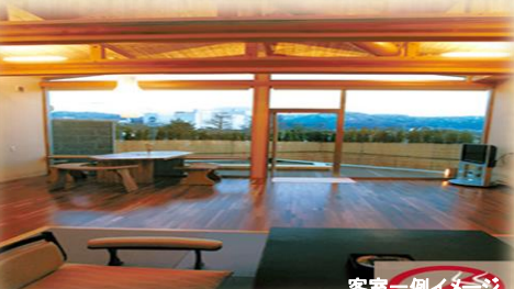
客室一例イメージ

チェックイン/14:00 チェックアウト11:00 ※お部屋の種類で時間が異なる場合がございます。 ○お部屋/和室・和洋室(露天風呂付有り) ○夕朝食/個室食事処